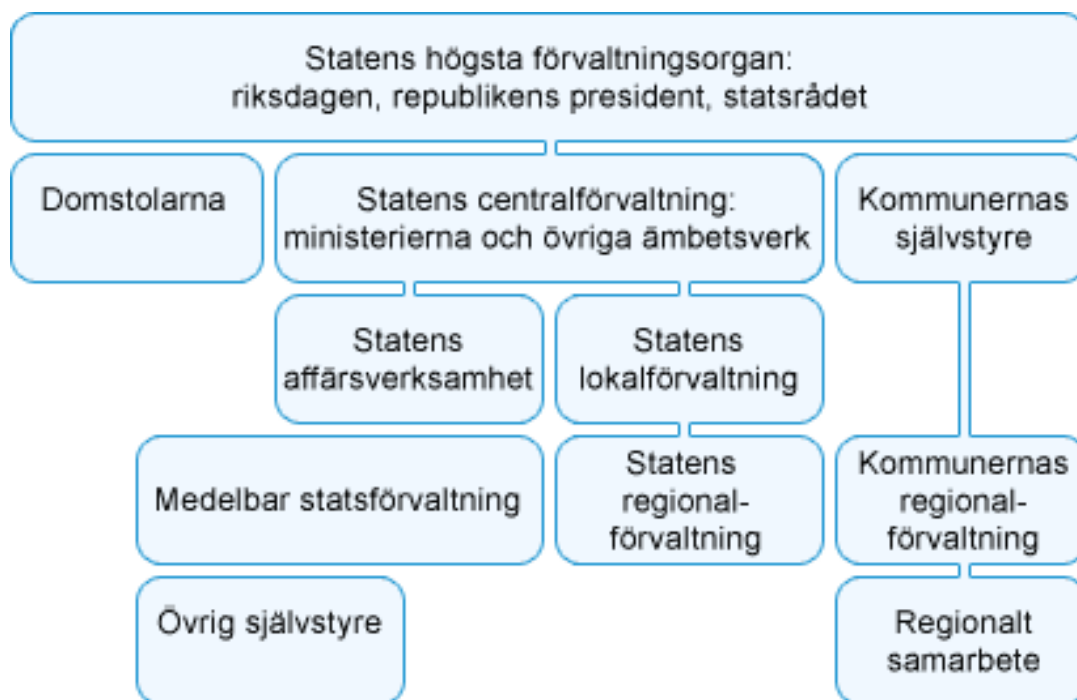
Figur 4. Den offentlige forvaltningens struktur i Finland (Kilde: www.suomi.fi ).

Statsforvaltningen finnes både på nasjonalt, regionalt og lokalt nivå. Den har om lag 123 000 ansatte. Av disse arbeider ca 5000 i ministeriene/departementene, 24 000 i de ulike etater og direktorater på sentralt nivå, mens 55 000 arbeider i statens regionale og lokale forvaltning. Om lag 31 000 arbeider i statlige universiteter og høyskoler, som er autonome enheter som styres av egne tillitsvalgte. Antallet statsansatte i dag er en betydelig reduksjon fra ca 215 000 i 1988, noe som skyldes en større strukturendring i statsforvaltningen på begynnelsen av 1990-tallet.