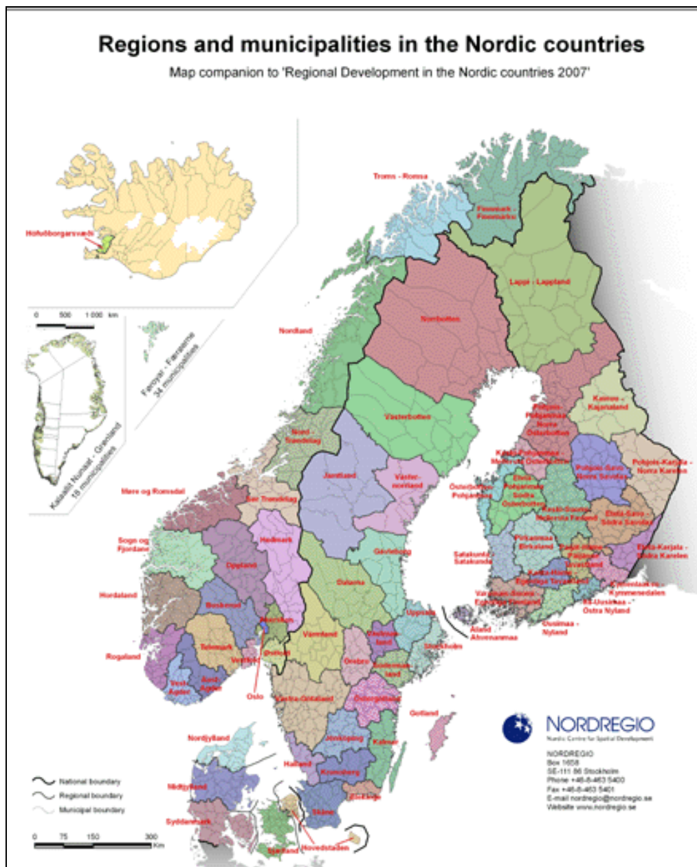
Figur 1: Regionale inndelinger i Norden 2007 (Nordregio).